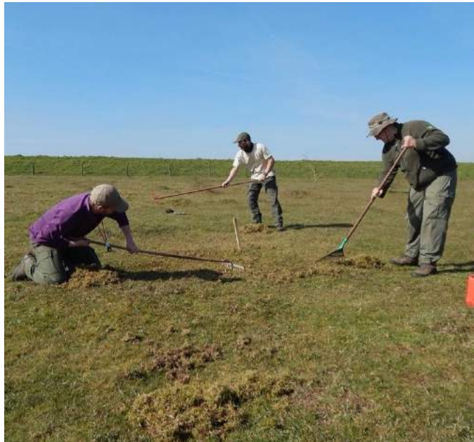
Boswachters aan het werk in Oeffelter Meent.

Staatsbosbeheer hoopt in 2022 het Maasheggenlandschap verder te kunnen herstellen door 'verdrongen heggen' langs de gedempte Virdsche Graaf te compenseren. Daarnaast werkt Staatsbosbeheer aan een nieuw inrichtingsplan voor de inrichting van het ontgrondingsgebied de Meerkampen.