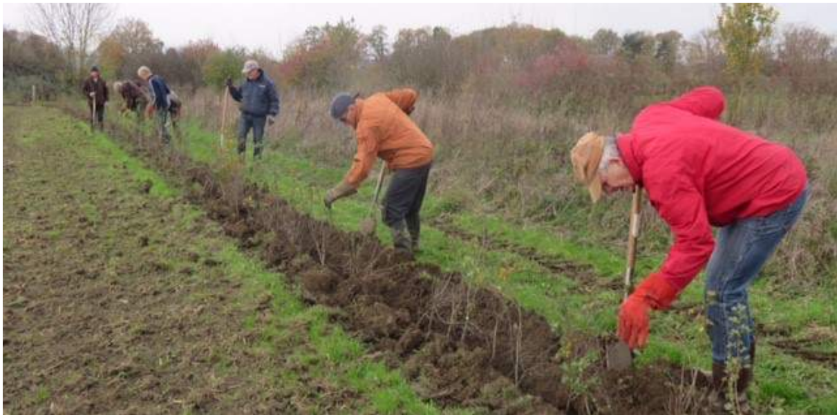
Vrijwilligers van SLaBox planten nieuwe heggen aan.

Gemeente Land van Cuijk, de Vereniging Nederlands Cultuurlandschap, Waterschap Aa en Maas, Stichting Landschapsbeheer Boxmeer (SLaBox), Collectief Deltaplan Landschap en enkele particulieren zijn al aangehaakt bij dit initiatief.