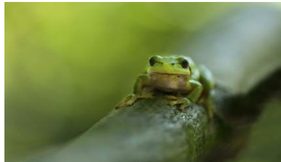
In De Maasheggen is in 2021 onder meer een groot aantal boomkikkers uitgezet.

Provincie Noord-Brabant heeft een financiële bijdrage beschikbaar gesteld voor het ontwikkelen van een boomkikkerbiotoop in dit gebied. In 2022 wordt gestart met de uitvoering van de inrichtingsmaatregelen.